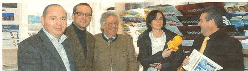
Offiziell eröffnet wurde nun der neue Tourismus-Info-Point bei der Shell-Tankstelle in Lannach

Die Angestellten der Tankstelle wurden entsprechend geschult. Neben Zimmernachweisen und Prospekten aus der Region können sie den Gästen mit den notwendigen Informationen behilflich sein. HANS AST